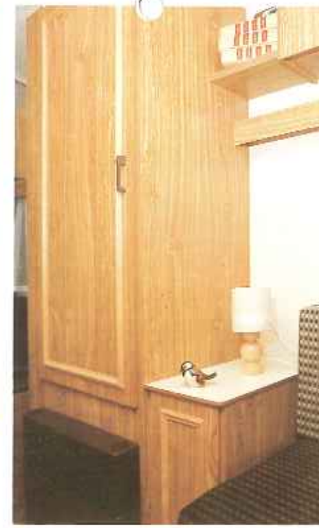
royale hangkast (C 380)