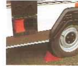
wielkeggen opgeborgen in een ingebouwd kastje (bij C 380 en C 440)