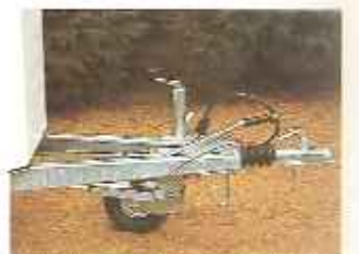
extra lange dissel voor betere gewichtsverdeling en wegligging