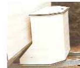
afsluitbare aluminium disselbak voor gasflossen

Het beste chassis ooit door Alko, mede voor CAVALIER, gemaakt.