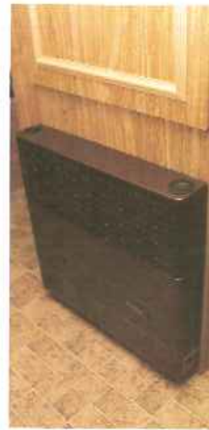
beveiligde Truma kachel