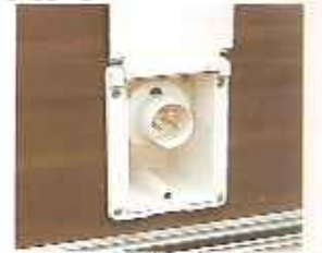
goedgekeurde 220 volt buitenstopkontaktkast NEN 1010