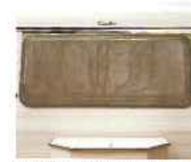
dubbele beglazing bruin ge- tint, goede lichtinval en prima isolierend, tegen condens