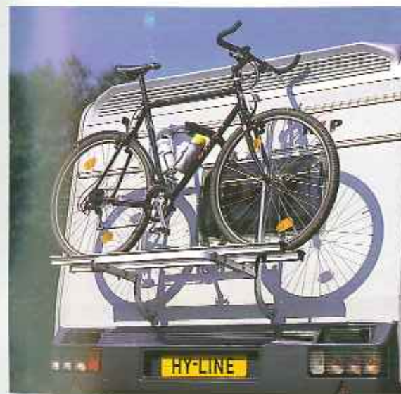
Mit diesem praktischen, speziell für Kip entwickelten Alu-Fahrradhalter können die Fahrräder für den Transport sicher am Caravan befestigt werden. Die Rückwand der Kip Caravans wurde zu diesem Zweck verstärkt. Es ist empfehlenswert, zugleich einen Stabilisator AKS 1300 oder 2000 zu montieren.

Kip Four Seasons Winter. Dieses spezielle Winterzelt bietet am Eingang Schutz gegen Kälte.