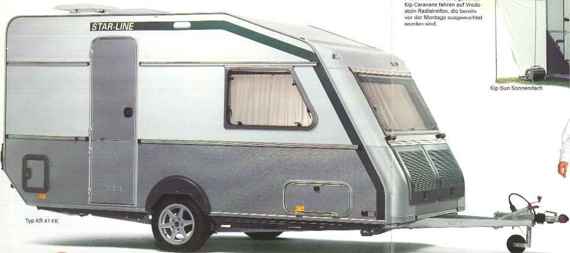
Typ KR 41 EK

Die isolierten Deichsolkastenklappen des Kip Star-Line sind aquagrün. An der Seite des Caravans befindet sich eine Gepäckkluke.