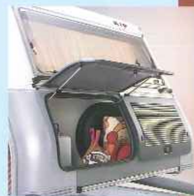
Der prägende Deichselkasten sorgt für bessere Aerodynamik und bietet unter anderem dem Wassertank, dem Gasbehälter und dem Reserverad Platz.