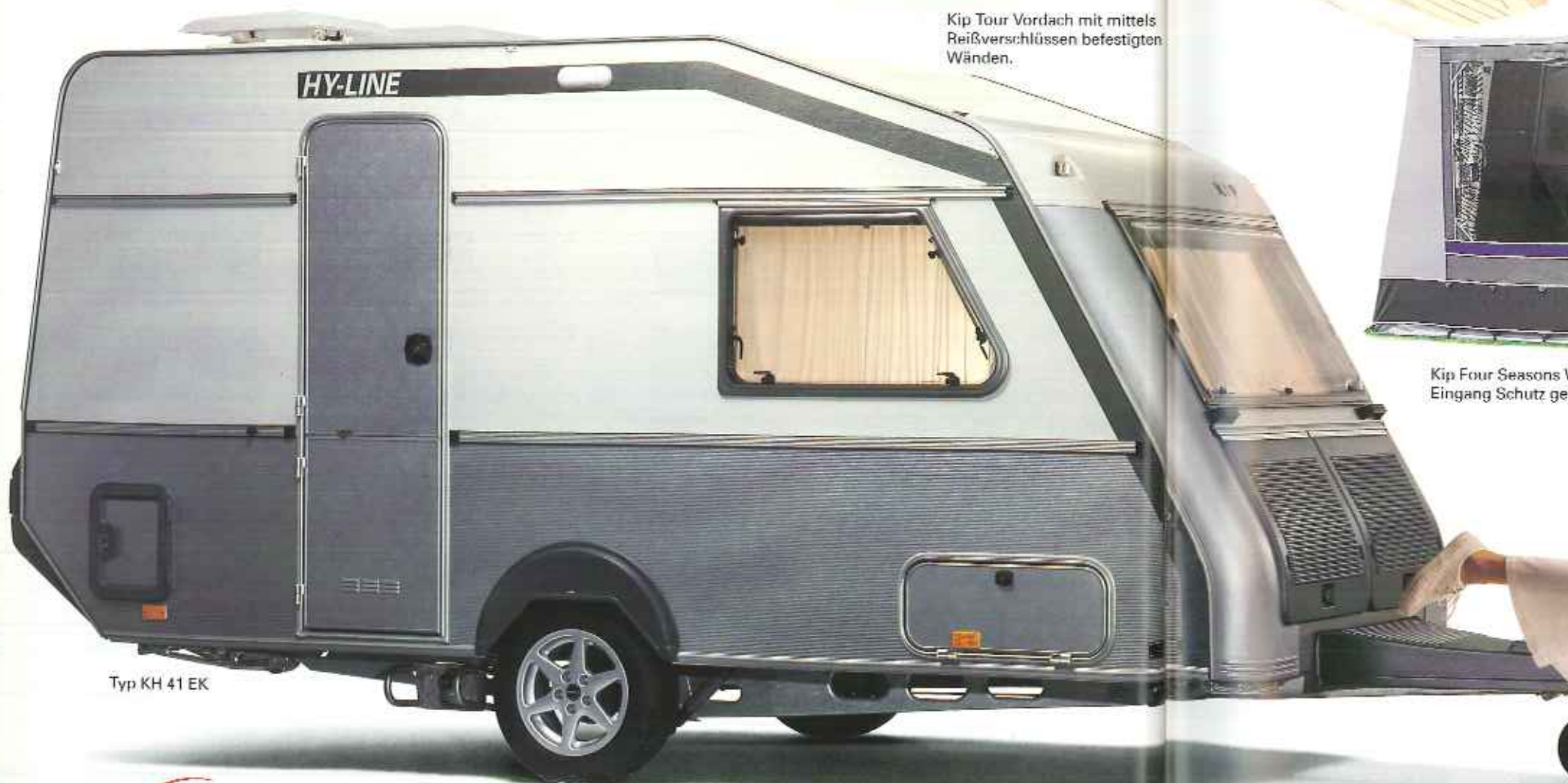
Typ KH 41 EK