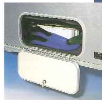
Der Gepäckraum des Grey Line ist von draußen durch eine Gepäckklappe an der Seite zugänglich.