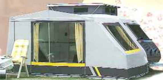
Kip Kompakt Vorzelt, mit einzeln aufrollbaren Frontteilen.

Zur Serienausstattung des Kip Kompakt gehören eine Nebelschlußbeleuchtung und ein Rückfahrscheinwerfer. Die Fenster sind mit einem schönen grau lackierten Rand versehen, der dem Caravan eine charakteristische Ausstrahlung verleiht.