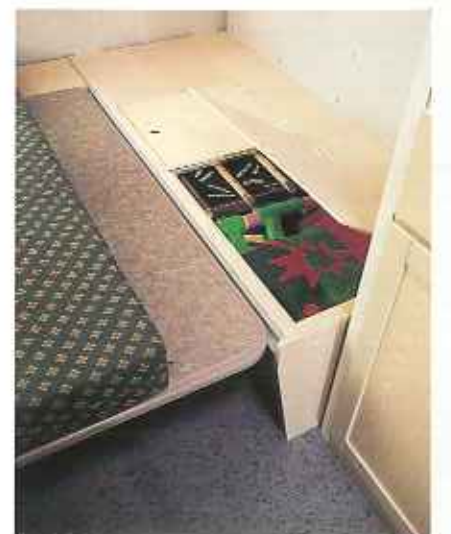
Der Bankkasten ist leicht zugänglich. Unverkennbar Kip ist die originelle Art des Bettaufbaus, wobei das Bett nicht wie üblich auf dem Tisch ruht, sondern auf einer gesonderten Schiene. Auf diese Weise ist nicht nur der Aufbau einfacher, die Konstruktion ist auch viel stabiler.