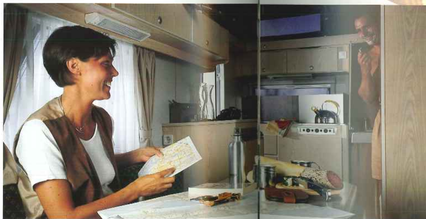
Interieur Typ KK 37 EK