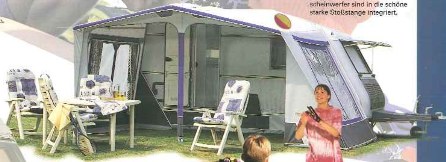
Kip Four Seasons, ein geräumiges Vorzelt aus Acryl.