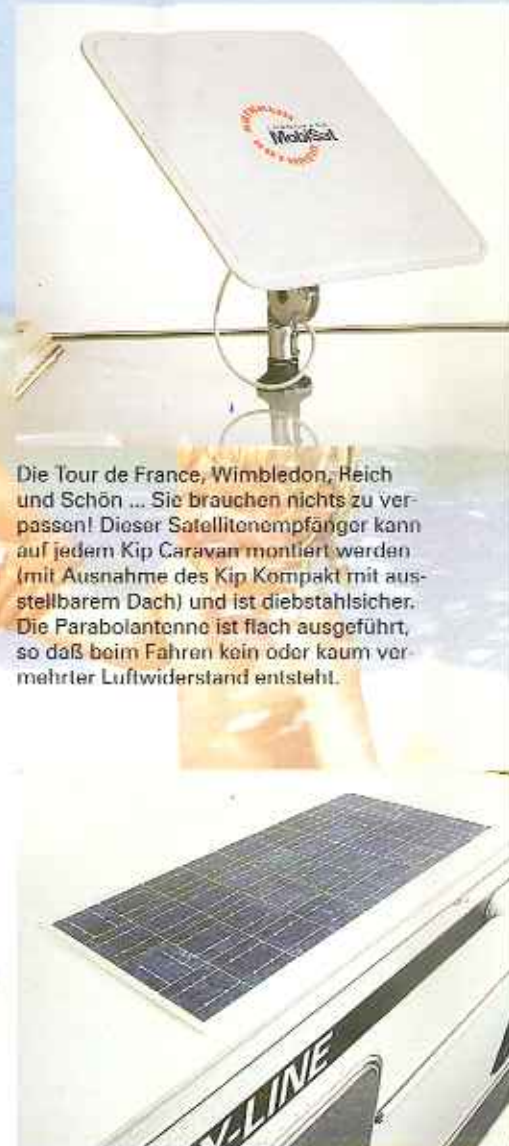
Die Tour de France, Wimbledon, Reich und Schön ... Sie brauchen nichts zu verpassen! Dieser Satellitenempfänger kann auf jedem Kip Caravan montiert werden (mit Ausnahme des Kip Kompakt mit ausstellbarem Dach) und ist diebstahlsicher. Die Parabolantenne ist flach ausgeführt, so daß beim Fahren kein oder kaum vermehrter Luftwiderstand entsteht.