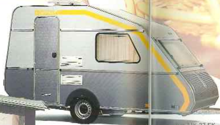
Typ MK 37 EK