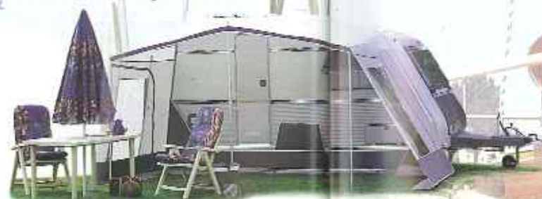
Kip Tour Vordach mit mittels Reißverschlüssen befestigten Wänden.