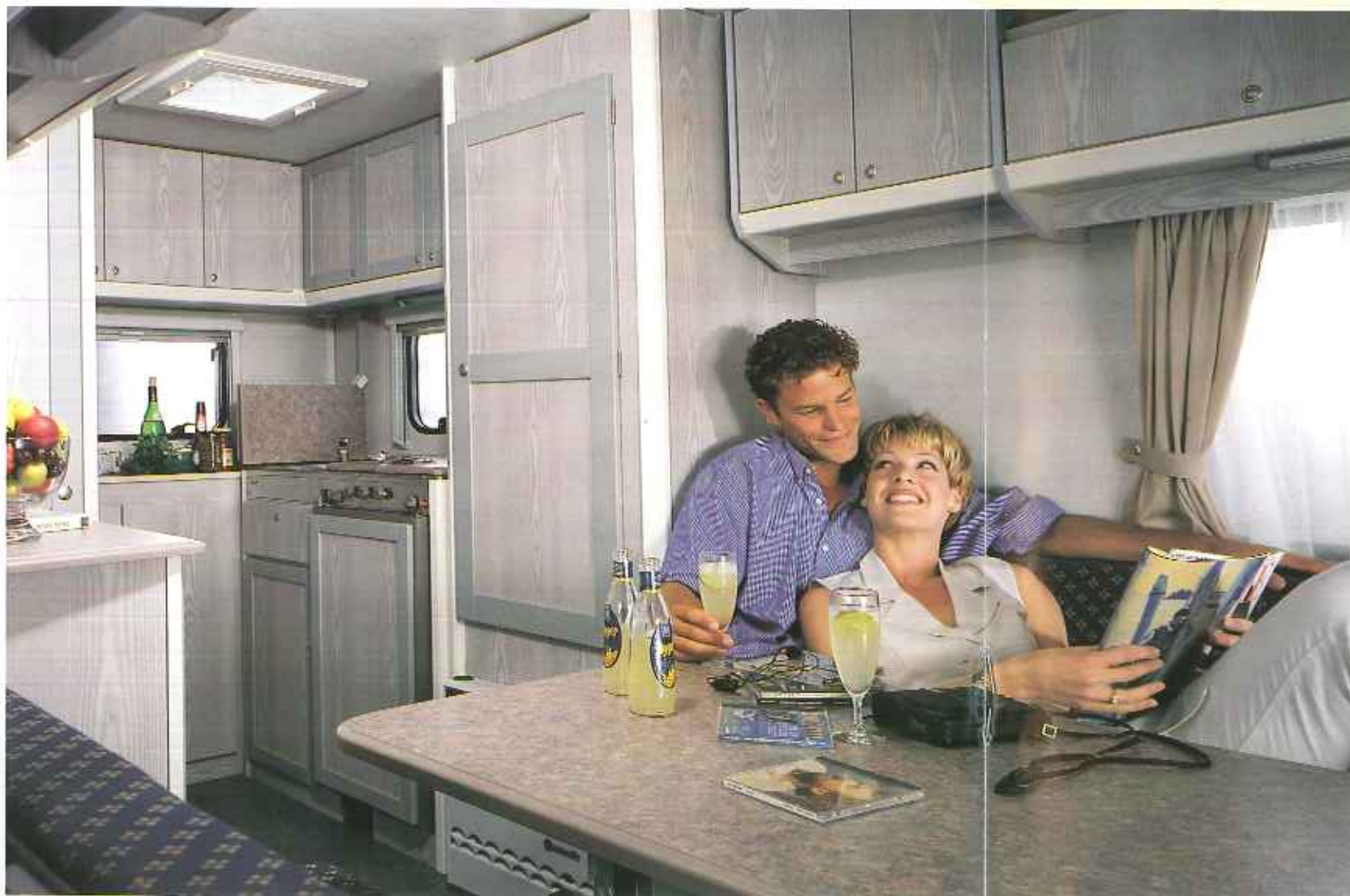
Interieur Typ KR 41 EKL