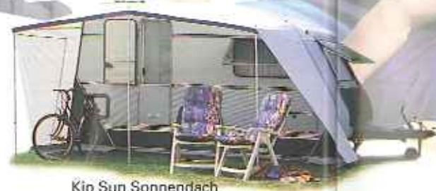
Kip Sun Sonnendach

Die schöne Front des Deichselkastens mit den zwei Klappen ist bezeichnend für den Kip Grey-Line. Der Deichselkasten ist beheizt, und die Klappen sind isoliert. Die Deichsel ist mit einer sehr schönen Abdeckung versehen.