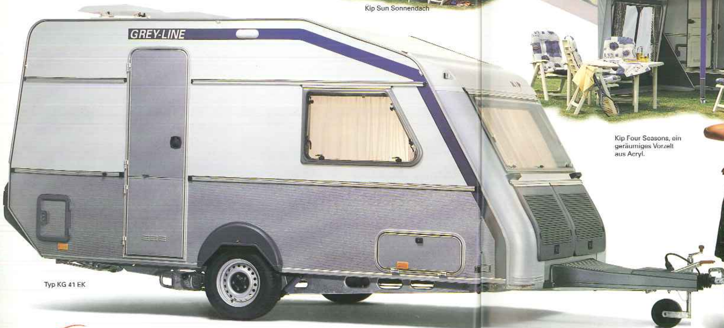
Typ KG 41 EK

Die Rücklichter, die Nebelschlussbeleuchtung und der Rückfahrcheinwerfer sind in die schöne starke Stoßstange integriert.