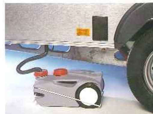
Der Abwasserbehälter wird mit einem Spezialbügel im Deichselkasten befestigt und kann problemlos unter den Caravan gestellt werden. Dieser fahrbare Behälter faßt 25 l. Zum Reinigen kann der Deckel losgeschraubt werden.

Obwohl unsere Caravans sehr gut und komplett eingerichtet sind, kann es natürlich ein, daß Sie noch einige Sonderwünsche haben. Auf dieser Seite finden Sie noch einiges sehr beliebtes Zubehör.