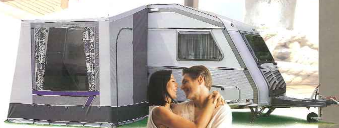
Kip Four Seasons Winter, bietet am Eingang Schutz gegen Kälte.

Mit dem 45 Watt Solar Panel ist Ihr Caravan in Bezug auf die Stromversorgung fast völlig autonom. So können Sie unabhängig von fremden Einrichtungen Ihren eigenen Weg gehen!