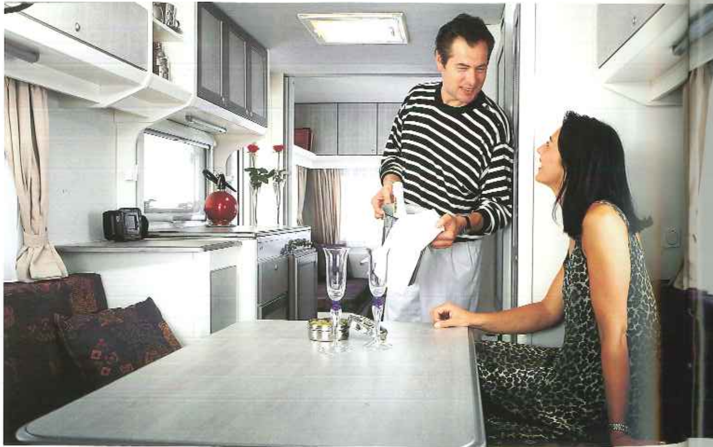
Interieur Typ KH 50 T

Das spezielle Belüftungssystem Airmix sorgt für ein angenehmes Klima im ganzen Caravan, im Sommer wie im Winter.