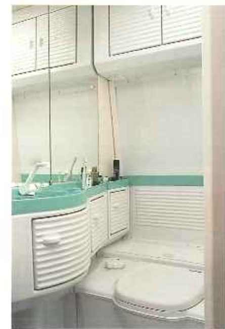
Durch die praktische Einteilung der Naßzelle mit Waschbecken, Unterschrank und Duschwanne bleibt genügend Bewegungsraum. Die Wasserleitungen sind innen verlegt, also frostgeschützt. Je nach Typ befindet sich die Naßzelle an der Seite oder hinten im Caravan.