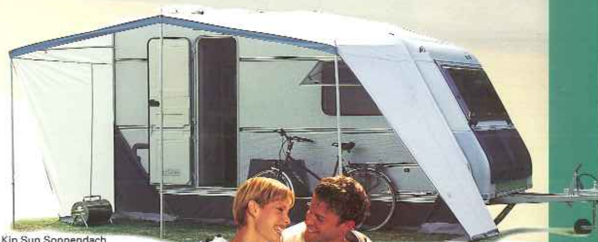
Kip Sun Sonnendach

Die Stabilisatorkupplung AKS 1300 sorgt dafür, daß der Caravan unter extremen Fahrverhältnissen nicht so schnell ins Schleudern kommt, bietet also ein Stück extra Sicherheit.