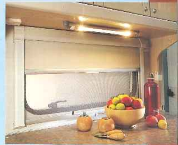
Die drohbaren Halogenstablampen sind dauerhafter Qualität und erfüllen eine Doppelfunktion: Sie können sowohl für indirekte Beleuchtung als für direktes Licht sorgen.