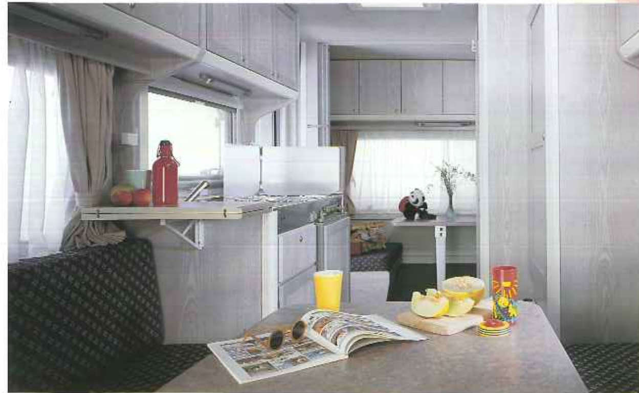
Interieur Typ KS 41 T

Das gemütliche Interieur des Kip Sun-Line bietet viel Wohn- und Laderaum und für jeden eine bequeme Schlafstätte. Auch für ein Spielchen ist genügend Platz, wenn es einmal regnen sollte. Über der Sitzecke hinten kann bei verschiedenen Ausführungen durch ein Hochbett ein zusätzlicher Schlafplatz für Kinder geschaffen werden.