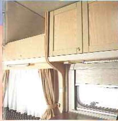
Die drehbaren Halogenstablampen im Kip Sun-Line sorgen für stimmungsvolle Beleuchtung. Alle Flügelfenster sowie die Dachluke sind mit Combi-Rollos (Kombination von Fliegenfenster und Vordunklungsvorhang) versehen.

Das Interieur des Kip Sun-Line ist sehr stimmungsvoll und gemütlich. Durch die praktische Einteilung bietet der Caravan viel Platz. Sie können zum Beispiel bequem eine gute Mahlzeit bereiten, ohne erst alles auf den Kopf stellen zu müssen. Der starke Vinylfußbodenbelag kann schon einiges vertragen und ist leicht zu pflegen. Der Caravan ist mit vielen verschiedenen Einteilungen lieferbar, so daß für jede Familie sicherlich ein passender Sun-Line zu finden ist.