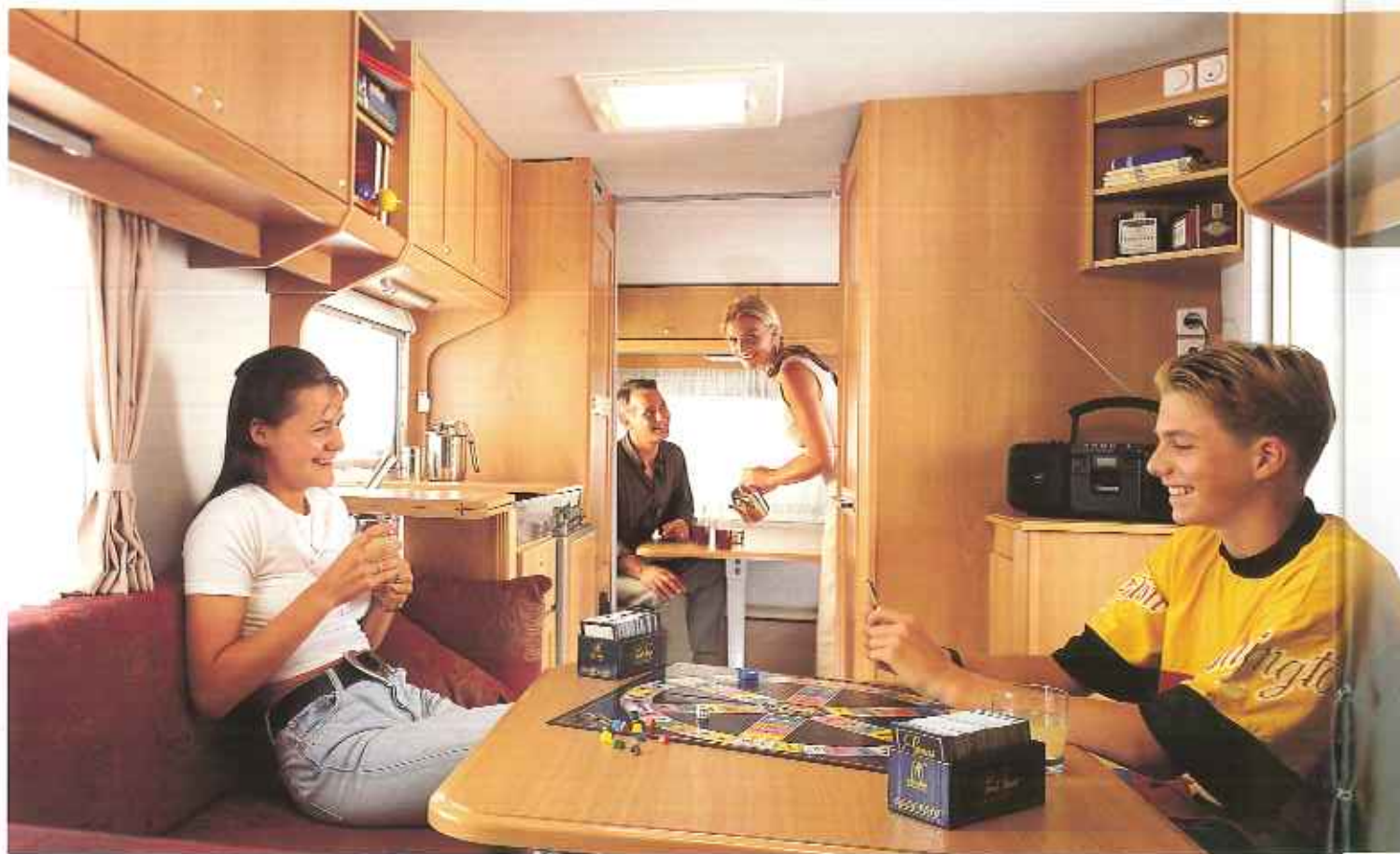
Interieur Typ KG 50 TRZ

Der Kip Grey-Line ist eigentlich ein Fünf-Sterne-Luxusappartement auf Rädern. Die gemütliche Sitzecke ist besonders stimmungsvoll und behaglich durch die Rundum-Zentralheizung. Aus den Kissen läßt sich im Handumdrehen ein großzügiges Bett zaubern. Die luxuriöse Küchenzeile mit der praktischen Edelstahlabdeckung ist so gestaltet, daß sie viel Platz bietet. Kurz, wohin Sie auch fahren, Sie genießen den gewohnten Luxus und Komfort.