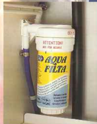
Bei allen Kip Caravans ist in die Zuleitung zum Wasserhahn ein Wasserfilter eingesetzt, so daß Sie immer mit kristallklarem Trinkwasser versehen sind.