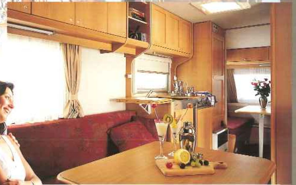
Interieur Typ KH 50 TRZ