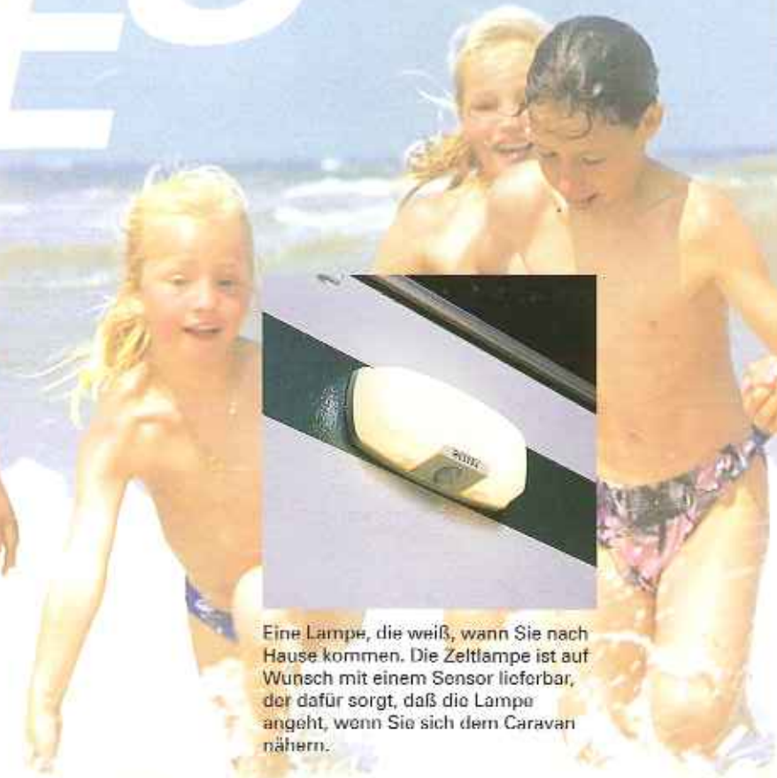
Eine Lampe, die weiß, wenn Sie nach Hause kommen. Die Zeltlampe ist auf Wunsch mit einem Sensor lieferbar, der dafür sorgt, daß die Lampe angeht, wenn Sie sich dem Caravan nähern.