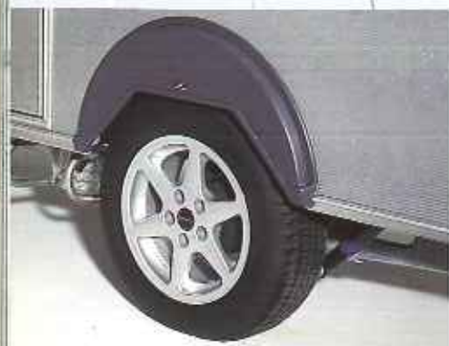
Der Hy-Line hat Leichtmetallfelgen und Vredestein-Radialreifen.

Der Kip Hy-Line ist einsame Spitze. Dieses Topmodell von Kip hat wirklich alles, was die moderne Caravan-Technologie zu bieten hat, umrahmt von optimalem Luxus und Komfort. Kompletter geht es einfach nicht! Exterieur und Interieur des Hy-Line stimmen mit dem Grey-Line überein, der Hy-Line ist jedoch serienmäßig mit attraktivem Zubehör ausgestattet und läßt somit kaum etwas zu wünschen übrig.