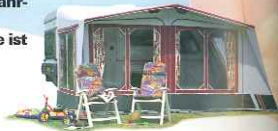
Kip Travcl, ein besonders geräumiges Vorzelt.

Mit seinem aerodynamischen Design, seiner sportiven Ausstrahlung und den gepflegten Details ist der Sun-Line ein echter Kip Caravan, in dem sich die ganze Familie wohlfühlt. Durch seine Euro-Achse mit dem 'selbstdenkenden' Delta-System zeigt der Kip Sun-Line ein besonders gutes Fahrverhalten und sichere Straßenlage. Kurz, der Kip Sun-Line ist die ideale Ferienunterkunft für die ganze Familie.