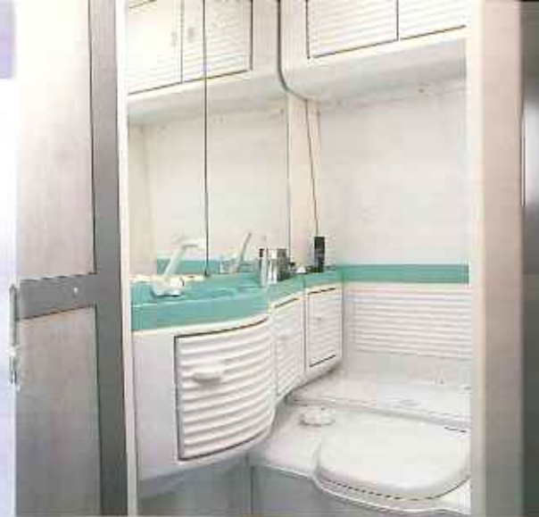
Im Toilettenraum des Kip Star-Line befindet sich eine Luxus-Cassette-Toilette, die serienmäßig mit elektrischer Spülung ausgestattet ist. Der Abwasserbehälter der Toilette ist von draußen herausnehmbar.

Beim Entwurf des geschmackvollen Interieurs des Kip Star-Line wurde ein Innenarchitekt zu Rate gezogen. Der Star-Line ist mit schönen Softline-Möbeln und komfortablen Kissen ausgestattet. Durch die große Auswahl an Farbkombinationen und die vielen verschiedenen Einteilungsmöglichkeiten lässt sich die Einrichtung weitgehend Ihrem persönlichen Geschmack anpassen. Die solide Ausführung und die gepflegten Details sind wieder echt Kip.