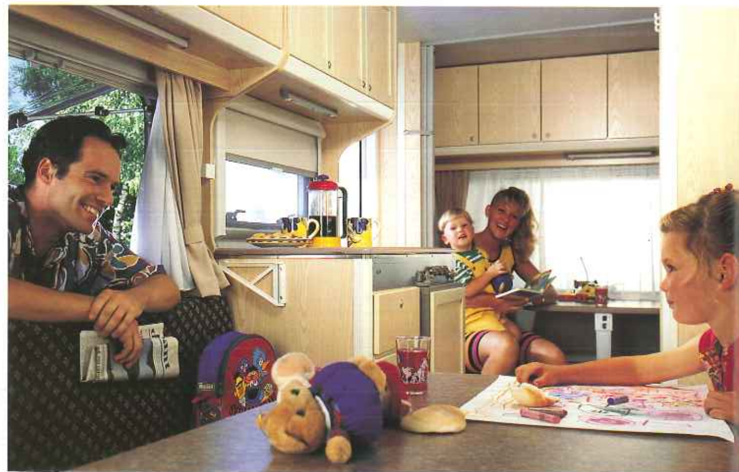
Interieur Typ KS 41 T