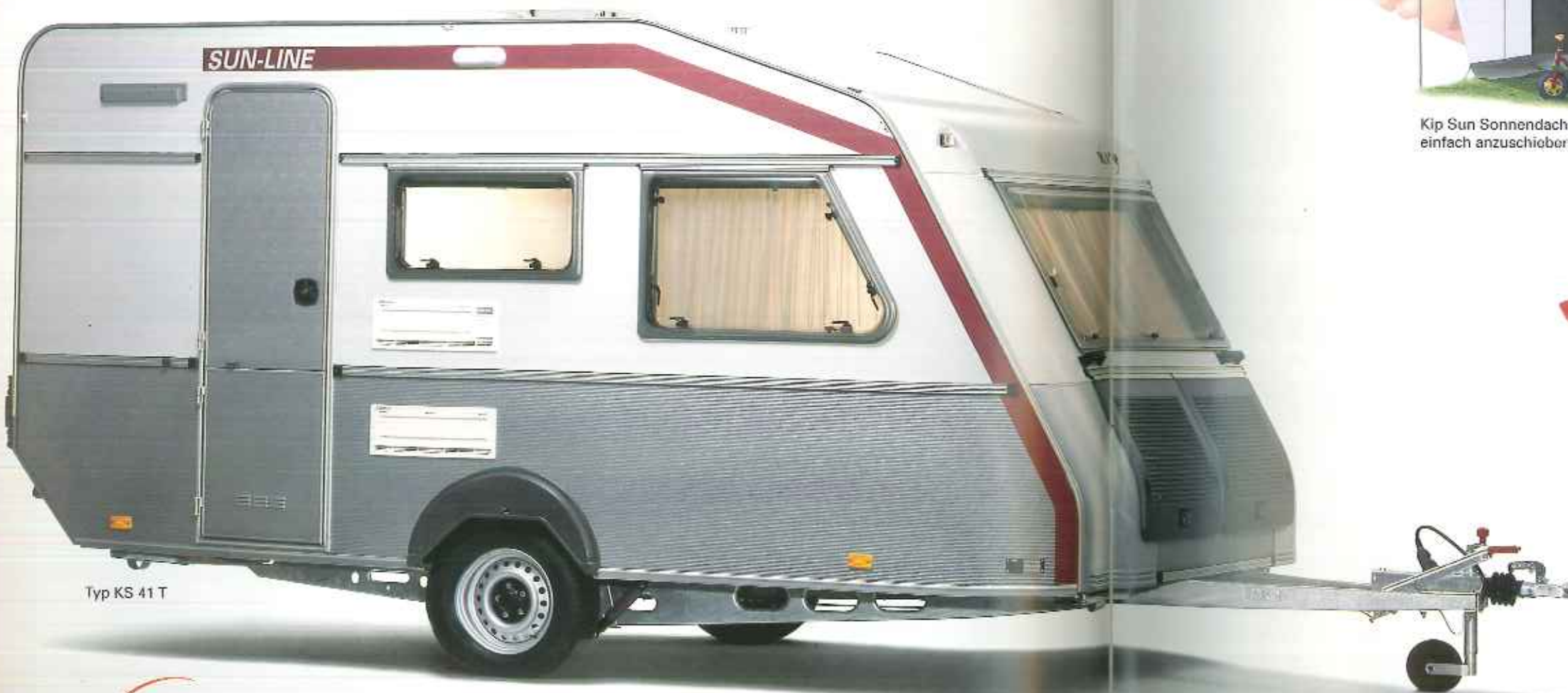
Typ KS 41 T