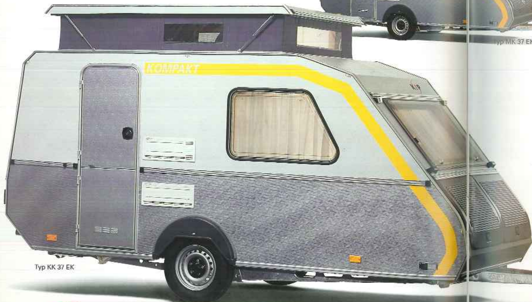
Typ KK 37 EK

Durch eine ausgereifte Konstruktion läßt sich das Dach des Kompakt mit Hilfe von Gasfedern problemlos ausstellen.