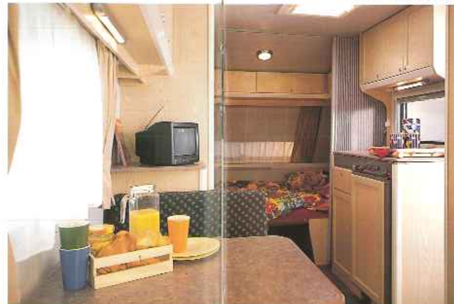
Interieur Typ KS 44 TTZ