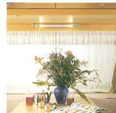
Die drehbaren Halogenstablampen erfüllen eine Doppelfunktion: Sie können sowohl für indirekte Beleuchtung sorgen als auch für direktes Licht, falls Sie lesen möchten.