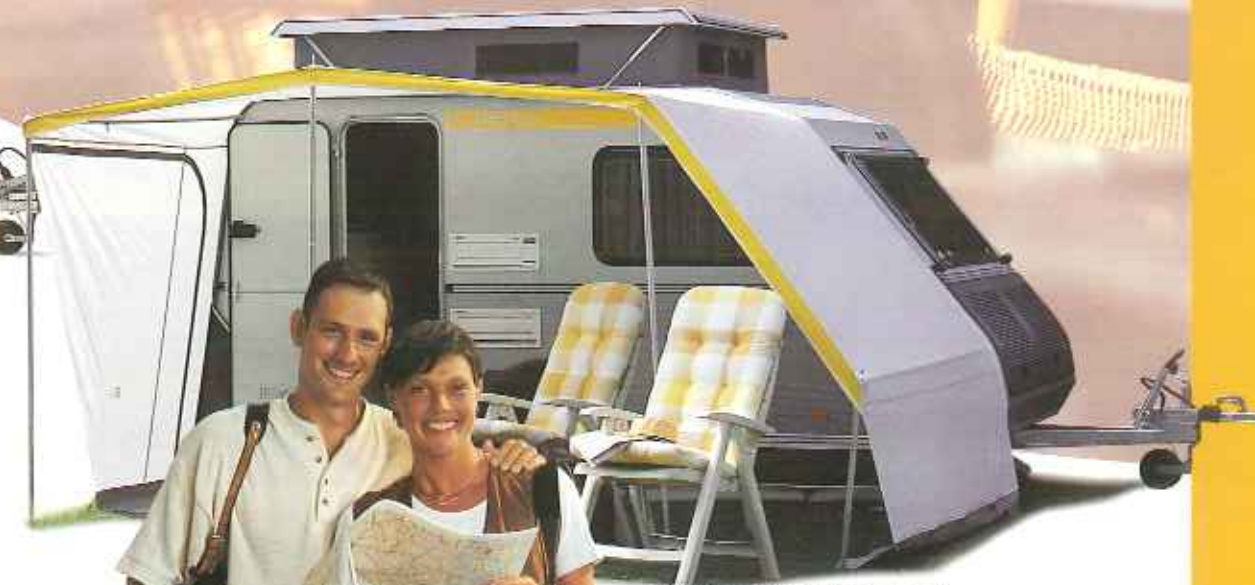
Kip Kompakt Vordach, schnell und leicht zu befestigen.