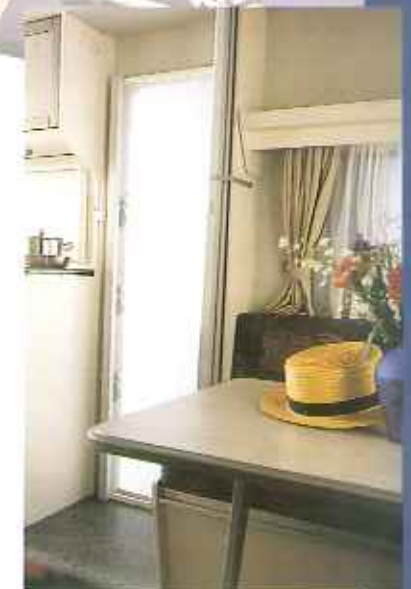
Das Fliegengitter in der Außentür ist sehr praktisch und macht den Aufenthalt im Caravan besonders im Sommer sehr viel angenehmer.