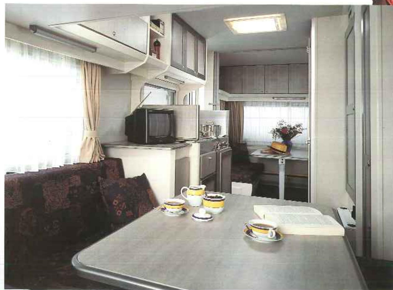
Interieur Typ KG 50 T

Die komfortable Einrichtung des Grey-Line ist wieder typisch Kip: modern und ergonomisch. Die Bänke mit den keilförmigen Kissen bieten optimalen Sitzkomfort. Die ingenieure Rundum-Zentralheizung sorgt nicht nur für Wärme im Rücken, sondern auch für gleichmäßige Wärme im ganzen Caravan. Der große Gepäckraum unter den Bänken ist durch eine Luke an der Seite leicht zugänglich.