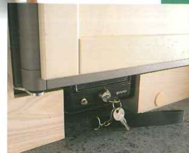
Alle Kip Caravans haben einen Tresor, in dem Sie Ihre Wertsachen sicher aufbewahren können.